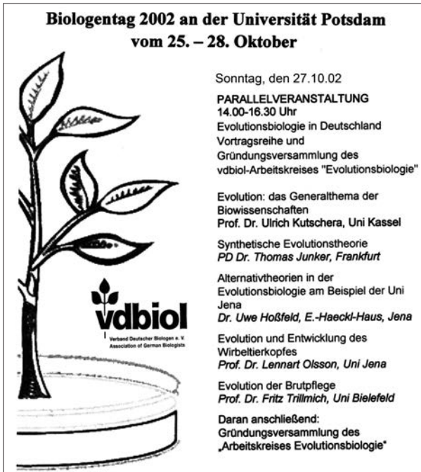
Abb. 3. Original-Dokument zur Gründung des Arbeitskreises Evolutionsbiologie im Deutschen Biologenverband mit dem alten Logo des vdbiol, Potsdam, 27. Oktober 2002.