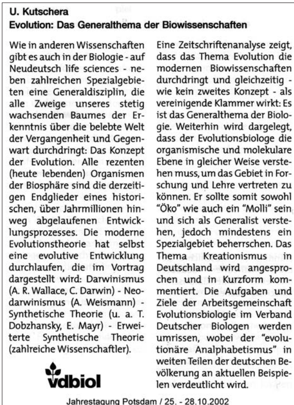
Abb. 4. Kurzfassung der Eröffnungsrede des ersten Vorsitzenden des AK Evolutionsbiologie (U. KUTSCHERA), gehalten am Sonntag, den 27. Oktober 2002, an der Universität Potsdam (Original-Dokument aus dem Tagungsband, Biologentag 25. bis 28. Okt. 2002, Potsdam).